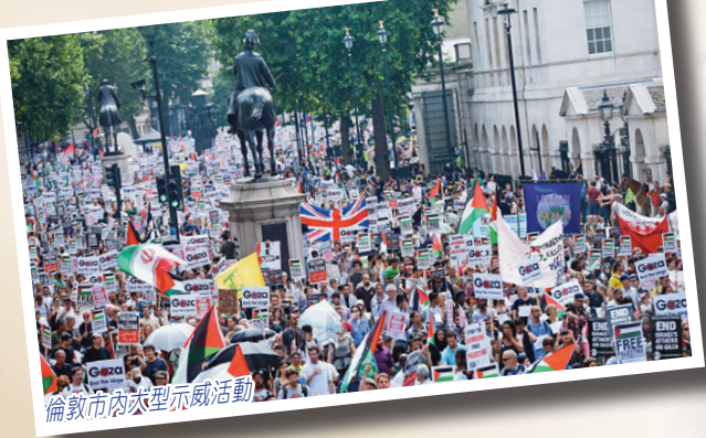
倫敦市內大型示威活動